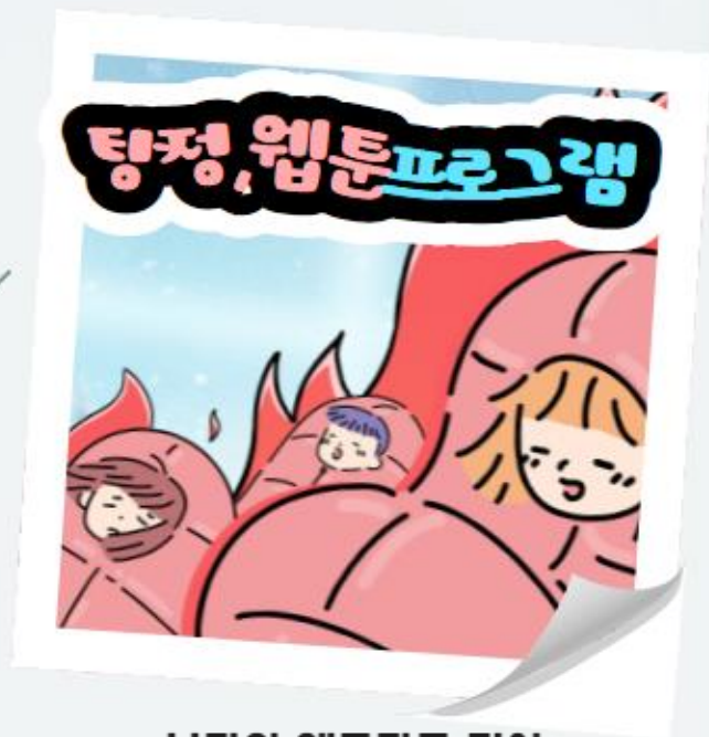
나만의 웹툰작품 전시